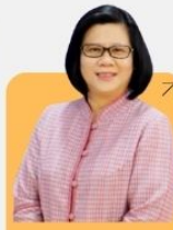
ศ.ดร. จกาทพร น่วนวณนา มหาวิทยาลัยมหิดล