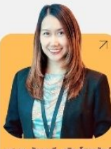
ศ.ดร. คิติยานันท์ เจริญโสการัตน์ มหาวิทยาลัยราชภัฏมหาสารคาม