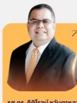
ศ.ดร. กิติโรจน์ หันตชาลา มหาวิทยาลัยขอนแก่น