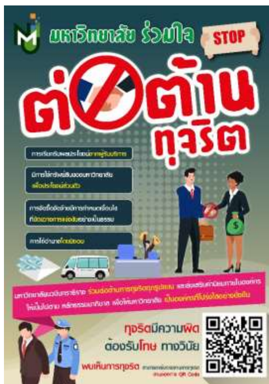
โปสเตอร์ประชาสัมพันธ์การป้องกันทุจริต

การประชาสัมพันธ์การป้องกันทุจริต เป็นรายงานงานในรูปแบบ Infographic ทุกช่องทางของมหาวิทยาลัย เดือนละ ๒ ครั้ง พร้อมกับมี QR Code หรือลิงก์ https://bit.ly/๒RKSa๒m สำหรับการรายงานการทุจริต